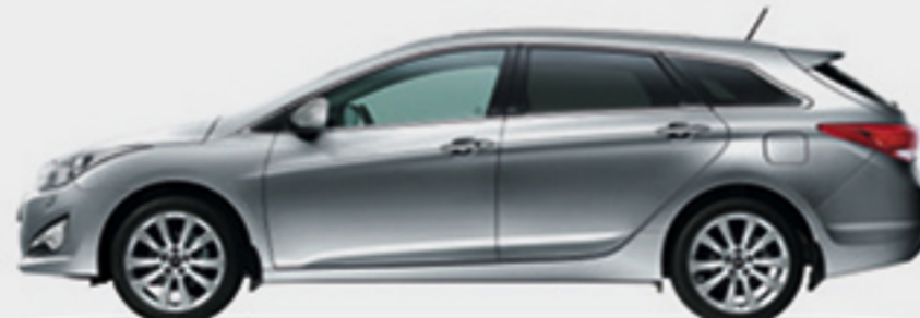
920 2,770 1,080 4,770