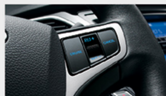
کنترل سیستم کروز روی فرمان