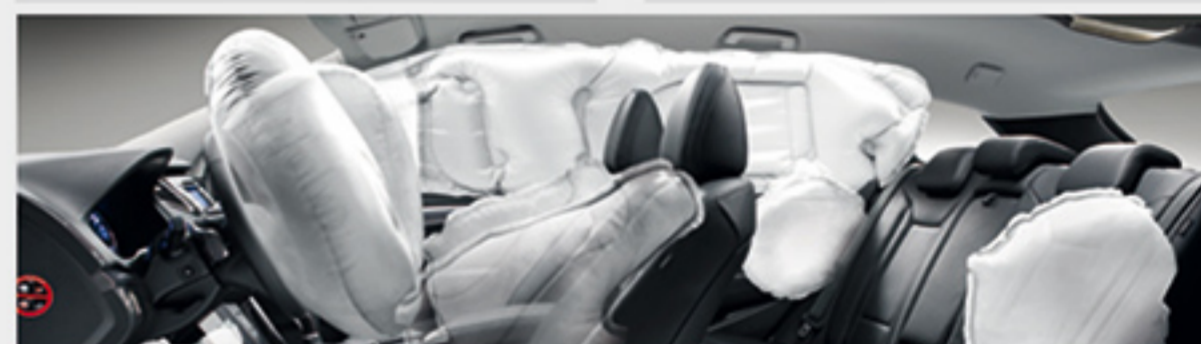
۹ کیسه هوا ( ۲ عدد جلو + ۲ عدد جانبی جلو + ۲ عدد جانبی ردیف عقب + ۲ عدد پرده ای + ۱ عدد زانویی )