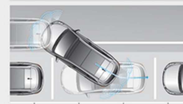
سیستم هشدار پارک برای جلو و عقب خودرو