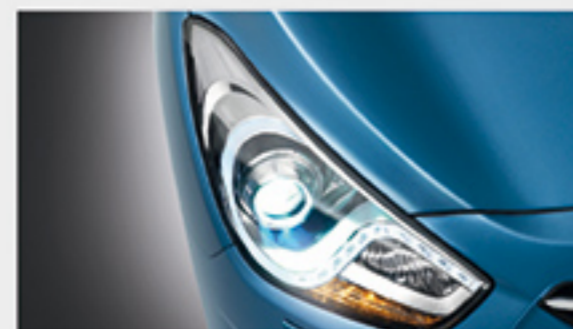
چراغ های جلو مجهز به LED