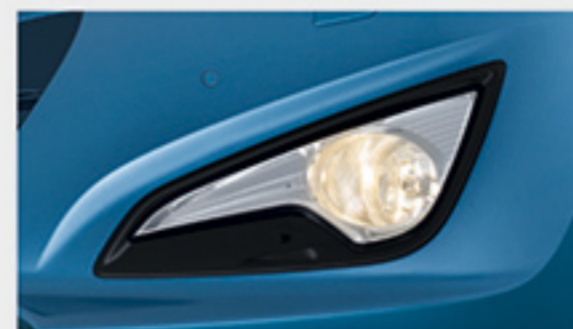
مه شکن جلو