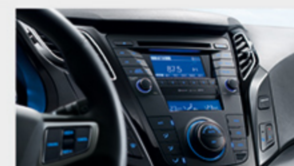
سیستم صوتی حرفه ای Infinity با امکان تنظیمات بر روی فرمان