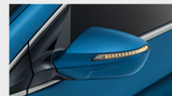
چراغ های LED راهنما آینه های جانبی