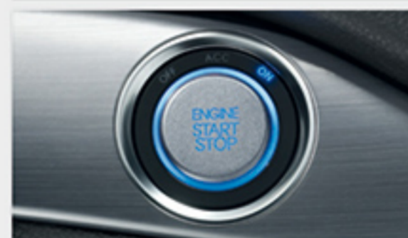
دکمه روشن و خاموش کردن خودرو